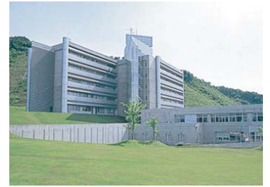
海洋生物資源センター

会場 福井県立大学小浜キャンパス 海洋生物資源学部棟テレビ講義室 〒917-0003 福井県小浜市学園町1-1 TEL 0770-52-6300(代) (宿泊先: サンホテルやまね 〒917-0069 福井県小浜市白ひげ海岸 TEL:0770-52-1450)