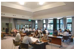
昨年の合宿研修会

お申込・問い合わせ先 tubokawa@fukui-nct.ac.jp 電話: 0778-62-8244